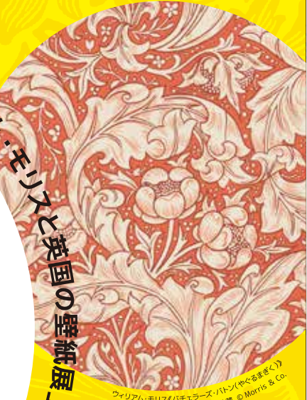
ウィリアム・モリス《チェルーズ・バートン(やぐらまき)》 1892年 サンダーソン社蔵 © Morris & Co.