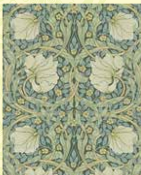
ウィリアム・モリス《ビンバーネル(ありはこべ)》 1876年 サンダーソン社蔵 © Morris & Co.