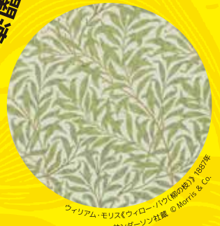
ウィリアム・モリス《ワイロー・バートン(朝の露)》1897年 サンダーソン社蔵 © Morris & Co.